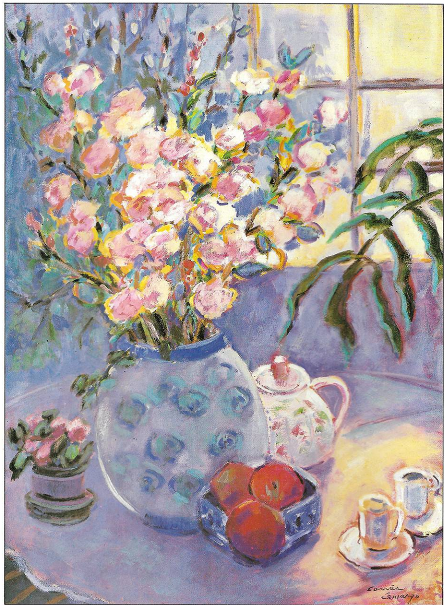
CONVITE PARA UM CAFEZINHO